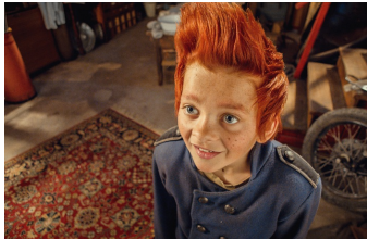
Doktor Proktors Puppulver