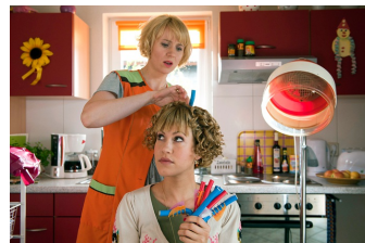
Heiter bis tödlich - Alles Klara