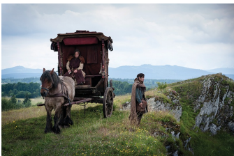
Der Medicus (Harsleben)