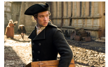
Goethe! (Osterwieck, Quedlinburg)