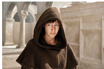
Die Päpstin (Gernrode, Harzgerode)