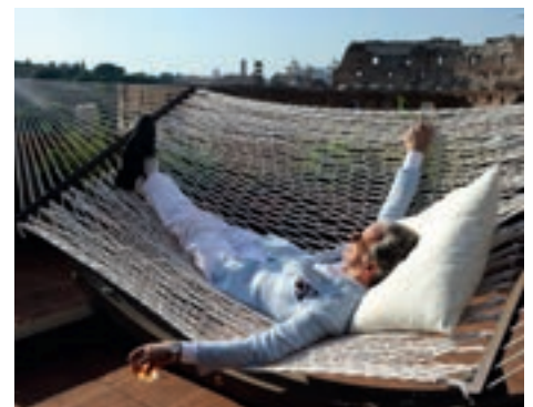
▲ „La Grande Bellezza“