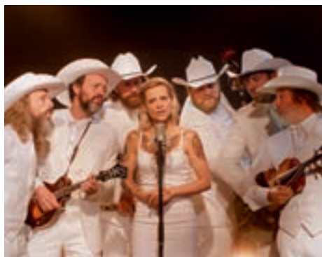
▲ „The Broken Circle Breakdown“