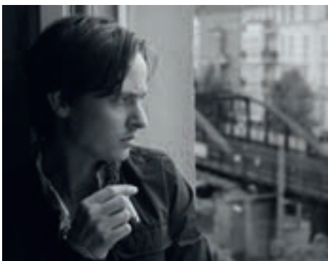
▲ „Oh Boy“