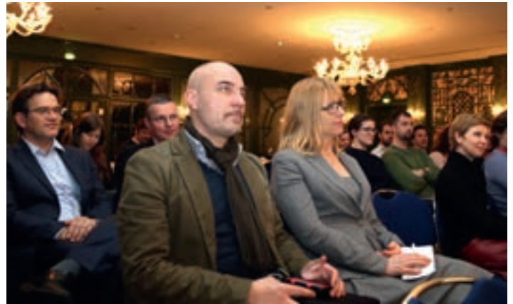
▲ ACE Financing-Workshop 2013