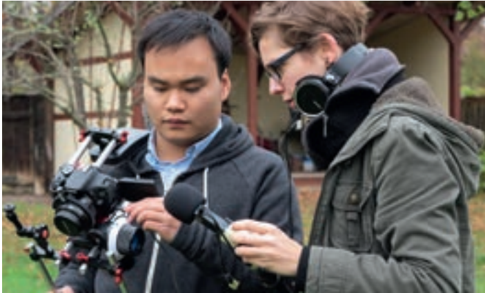
▲ Drehvorbereitungen beim Regieworkshop des TP2 Talent Pool